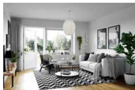
Inflyttning blir det i slutet av maj.

– Vid årsskiftet får vi tillbaka ett antal lägenheter från Migrationsverket. Vi undersöker nu möjligheten att renovera hälften av dem på vanligt sätt och hälften enligt modellen cirkulär ekonomi, vilket innebär att man där det är möjligt återanvänder material och produkter. Sedan jämför vi de båda kostnadskedjorna och ser om det finns några ekonomiska och miljömässiga lärdomar att dra.