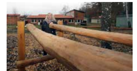
Ett utomhusgym, här i form av en så kallad naturlektyta, stod högt på listan.

– Sammantaget känns det verkligen som att vi har landat rätt i det här projektet. Det är en stor satsning – totalt blir det 2 435 000 kronor – men vi får många värdefulla erfarenheter med oss till det framtida arbetet med att skapa attraktiva och inkluderande områden.