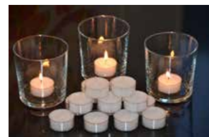
Var försiktig med värmeljus!

Värmeljus är trivsamma, men var försiktig; många värmeljus tillsammans kan orsaka en rökexplosion.