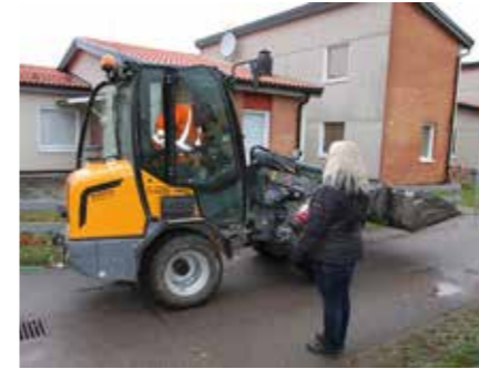
Ännu återstår lite arbete att göra innan grävskoporna kan lämna området.

Telefonnumret är 90 222. Du behöver inte slå något riktnummer. På hemsidan www.comhem.se finns tips och information om driftstörningar.