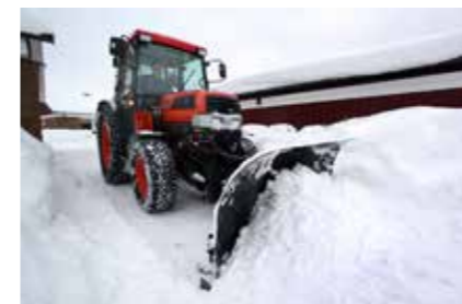
När snödjupet nått 3–5 centimeter påbörjar våra entreprenörer röjningen.

Snöröjning påbörjas när det fallit 3–5 centimeter. Våra entreprenörer börjar alltid runt skolor, förskolor, daghem och vårdbostäder, där röjning och halkbekämpning, som utförs med sandningsflis i storleken 2–5 millimeter, ska vara klart senast klockan 8.00.