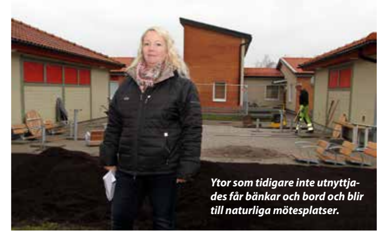
Ytor som tidigare inte utnyttjades får bänkar och bord och blir till naturliga mötesplatser.

– Vi har dessutom valt att plantera växter som redan