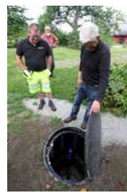
Inga kemikalier eller andra tillsatser behövs.