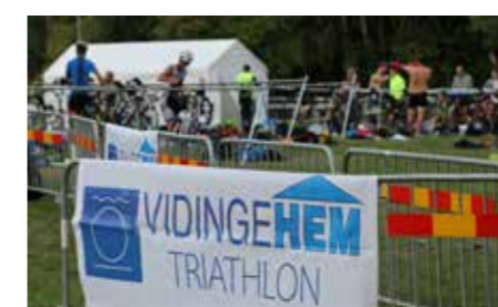
Febril aktivitet råder i området för växling från simning till cykling.

Efter att alla kommit i mål föll det traditionella godisregnet över barnen och sedan fortsatte Rottnedagen med aktiviteter för stora och små, fram till den avslutande pubaftonen i Sörabyhallen.