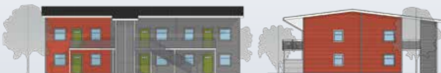
Furulidsvägen från framsidan (mot Tallskogen) samt från sidan (mot Furulidsvägen).

– Det är ett flexibelt och effektivt koncept med trygga och trivsamma lägenheter, med modern komfort och smarta energilösningar – förbrukningen hamnar på låga 55 kWh/m 2 .